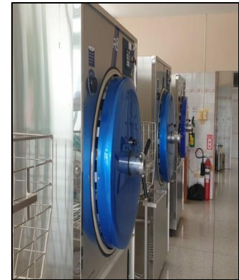
ห้องนึ่งเครื่องมือ