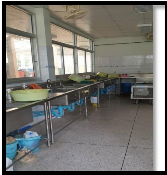
ห้องล้างเครื่องมือ

อ่างและบริเวณที่เพียงพอสำหรับ ล้างและเตรียมเครื่อง