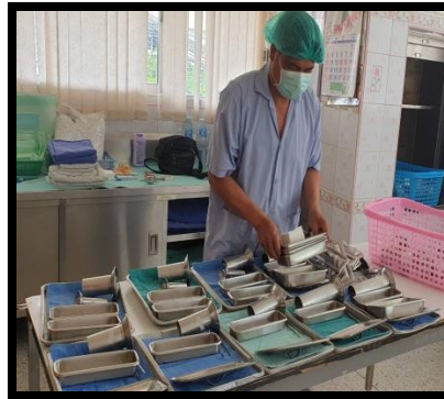
ห้องเตรียมเครื่องมือ