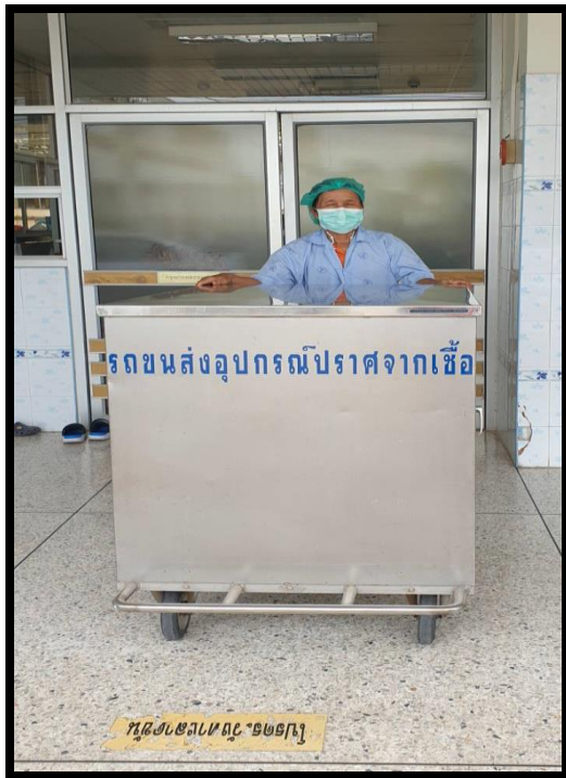
รถเข็นรับส่งสิ่งของสะอาด